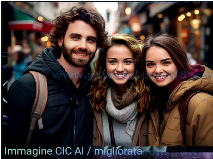
Immagine CIC AI / migliorata

Dopo aver orbitato attorno alla Terra per diversi anni e aver studiato la topografia e la geografia della Terra, nonché quali parti della società umana si trovano in quali aree geografiche, compresi tutti i suoi problemi, abbiamo scelto con cura alcune aree che sono le più sicure per noi, per andare a fare provviste. (Non posso dire quali, per ragioni di sicurezza, ovviamente).