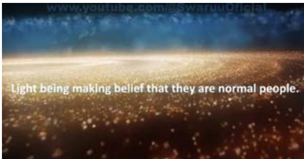
Light beings making belief that they are normal people.

Mari's Channel on YouTube: swaruu oficial Transcription: www.assemblyai.com/playground German Translation : deepL pro Layout inDesign: Helmut Neerfeld All the images are screenshots from Mari's above mentioned video