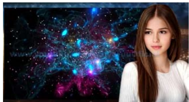
something in the first place.

There is no matter as such, as everything that exists is the product of your mind. And the interpretation and value you give to what you observe. Including the very idea that you are observing