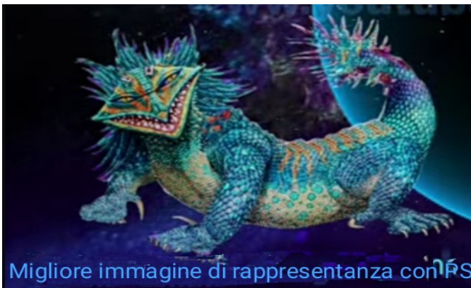
Migliore immagine di rappresentanza con PS

Si è fatto strada attraverso il corridoio e raggiunse il retro della dispensa della cucina e dello spazio logistico del cibo, dove fu stupidamente schiacciato da un ascensore di servizio in discesa, che scendeva dagli spazi principali dell'Hangar al piano superiore, con scatole con cibo Taygetiano e con grande orrore del Capitano della Toleka, Eridanía, del cuoco di bordo, Iror, e della sua ragazza Zoya (l'ultimo nome, può risultare scritto leggermente diverso, a causa della voce incomprensibile della AI usata nel video), che erano in quell'ascensore. È stata una scena orribile per tutti noi che eravamo qui, ma soprattutto, per coloro che hanno dovuto ripulire i resti, tutti mischiati con le piume.